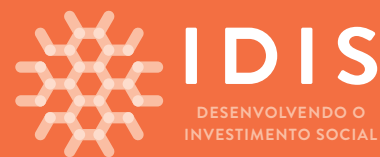
fundo laranja IDIS