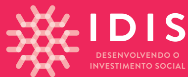
fundo cereja IDIS