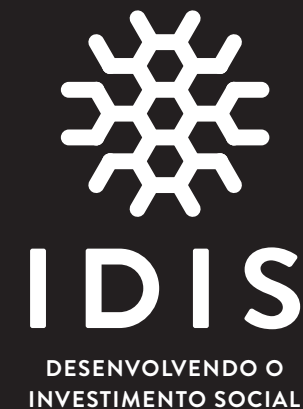
fundo preto (versão secundária negativa PB)